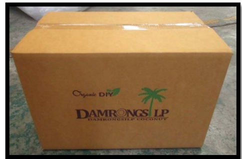
3rd Step/ขั้นตอนที่ 3