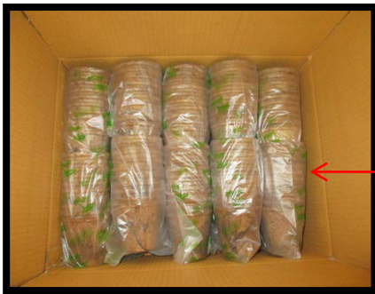
บรรจุ 2 ชั้น ชั้นละ 10 แพ็ค