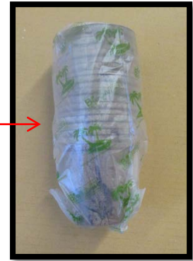
10 ชิ้น / 1 แพ็ค